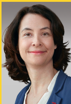
Estelle Brachlianoff, A Veolia főigazgatója

B árhol a világon, ahol a Veolia-csoport jelen van, arra törekszik, hogy saját értékeit, az egyes országok törvényeit, valamint a nemzetközi szervezetek által elfogadott viselkedési normákat - a 2019. április 18-án elfogadott küldetésével összhangban - közvetítse, és azok betartására másokat is ösztönözzön.